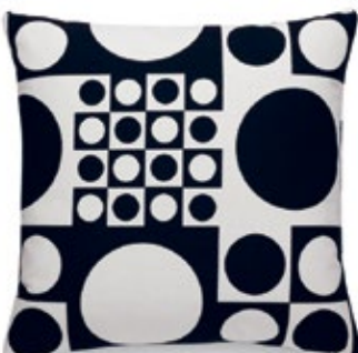
Classic Pillows Maharam Geometri black/white H 400 x B 400