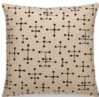
Classic Pillows Maharam Small Dot Pattern Document H 400 x B 400