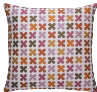
Classic Pillows Maharam Quatrefoil pink H 400 x B 400