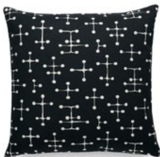
Classic Pillows Maharam Small Dot Pattern Document reverse H 400 x B 400