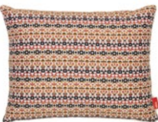
Classic Pillows Maharam Arabesque, crimson pink H 300 x B 400