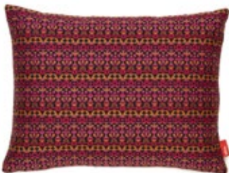
Classic Pillows Maharam Arabesque, pink orange H 300 x B 400